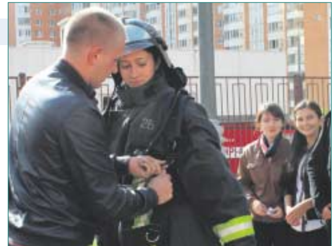
Завершилось показное тактическое занятие красочным показом тушения огня различными средствами и демонстрацией снаряжения пожарных – костюмов, противогазов, респираторов, ранцев. Все это дети примеряли на себя охотно и с большим интересом.

– На сегодняшних учениях эвакуация детей из школы происходила организованно и очень быстро, пожарные расчеты впечатляли технической оснащённостью, решительностью и профессиональностью действий. Чувствовалось, что у наших пожарных есть большой опыт. В этом году, 4 октября, исполняется 80 лет Гражданской обороне России. Хочу сказать спасибо всем сотрудникам МЧС за их труд и пожелать им поменьше работы!