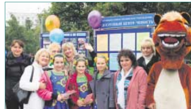
Стенд МБУ «Юность» на Дне города.

«Вольница» с зажигательными казачьими песнями, прекрасными голосами и красочными нарядами по настоящему увлек москвичей – некоторые пары стали танцевать, а подпевали голосистым казакам почти все зрители.