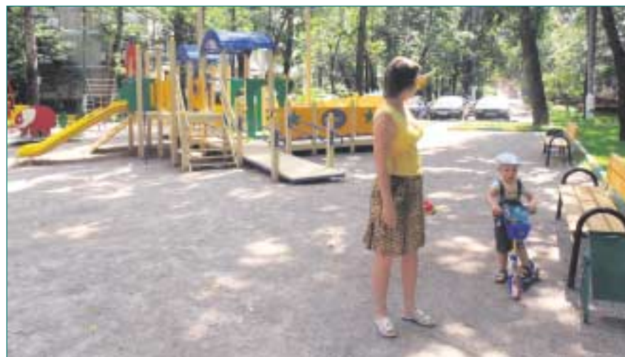
Межквартальный детский многофункциональный городок по адресу: Никитинская, д. 16.

В рамках дополнительного финансирования выполнены работы по благоустройству 48 объектов на территории района.