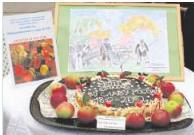
Выставка кулинарных изделий, пирогов, пирожных, фигур и картин из яблок, композиций, рисунков, поделок занимала весь центр площади и поражала богатством фантазии и мастерства, а запахи вкуснейшей выпечки дразнили обоняние.