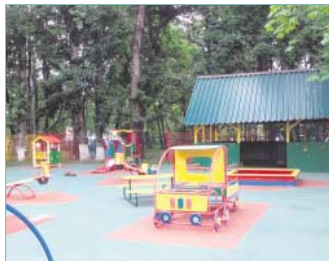
Территория школы № 347, благоустроенная в этом году.

Проведение следующей встречи главы управы с жителями запланировано на 15 октября, 19.00