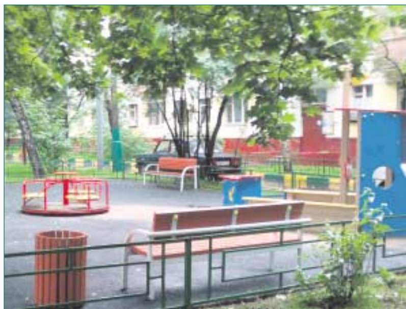
Дворовая территория по адресу: Шелковское шоссе, д. 52 корп. 2.