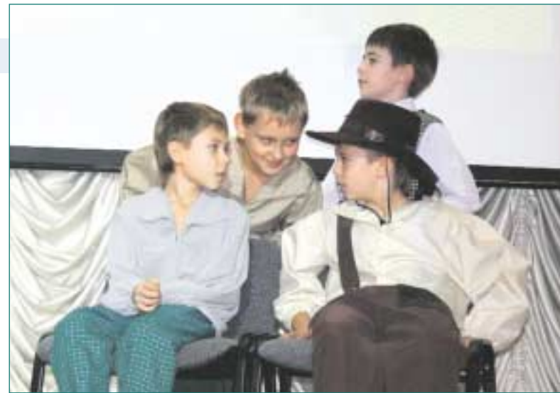
Выступление 3 «Б» класса.

«Поющие сердца» показали детям свой спектакль, посвященный памяти и творчеству Александра Сергеевича Пушкина.